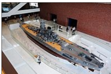
Au musée du Yamato...