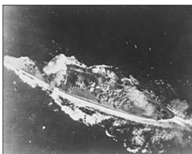
La fin du Yamato...