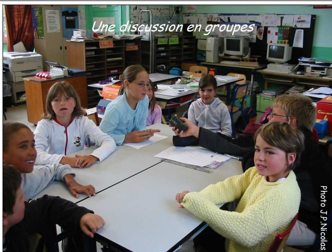
Une discussion en groupes