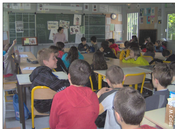
Débat lors de la venue de nos corres.