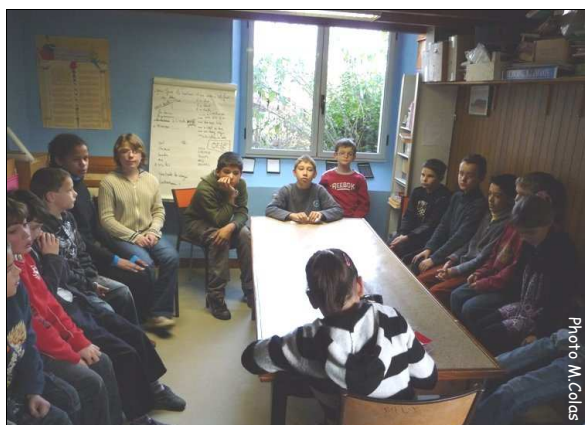
Conseil de coop: le président de la quinzaine est en bout de table, le secrétaire est de dos.

Tous les mardis, nous faisons un conseil de « coop ». Dans la classe, chaque enfant a un service pour une durée de 2 semaines : président, relations extérieures, entretien classe, documentaliste, bibliothécaire, entretien terrain, ... Si un enfant veut parler d'un sujet, il s'inscrit sur l'ordre du jour. Le président de la quinzaine prépare le conseil de coopérative, l'anime et le gère. Le secrétaire prend des notes. Nous discutons des problèmes de la classe et des choses qui marchent bien. Nous pouvons préparer nos projets, discuter sur un sujet, parler de nos correspondants. Nous avons fait un débat sur les droits des enfants.