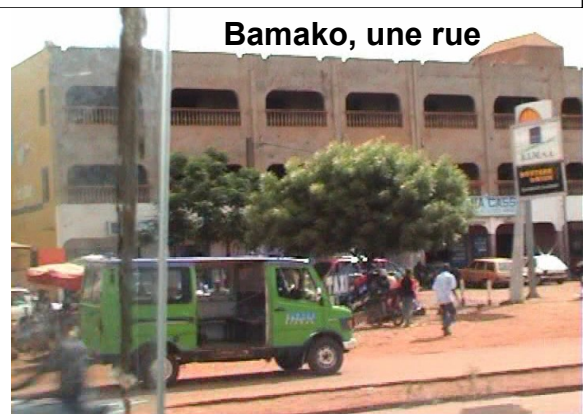
Bamako, une rue