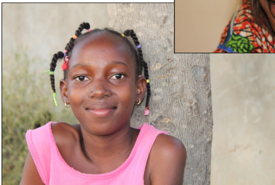
jeune fille dogon

La population malienne est constituée de différents peuples, dont les principaux sont :