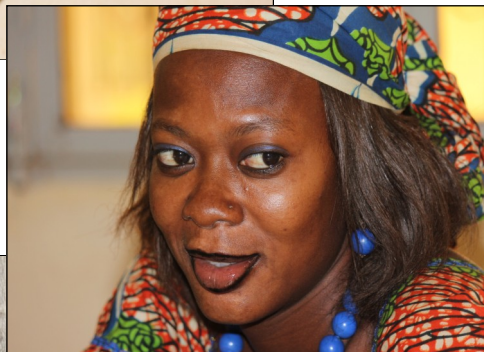
jeune femme bobo