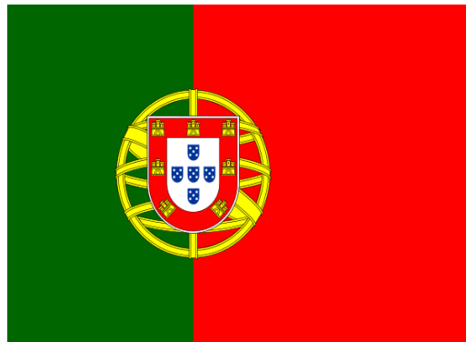
le drapeau du Portugal