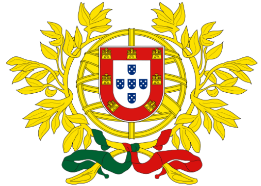
le blason du Portugal

Le Portugal est un pays d'Europe, du sud ouest de l'Europe.